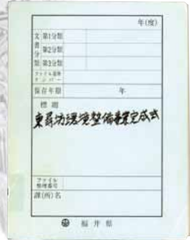
▲「東尋坊環境整備事業完成式」 18184 自然保護課 (1988年度)

事業の目的であった「個性ある美しい東尋坊の環境」がいつまでも続き、今後も多くの観光客が訪れることを願ってやみません。