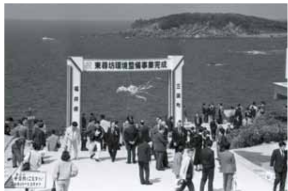
▲東尋坊環境整備事業竣工式 1989年 83577