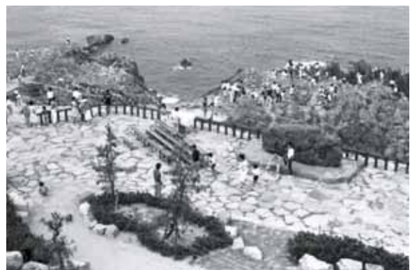
▲東尋坊 1989年 83758