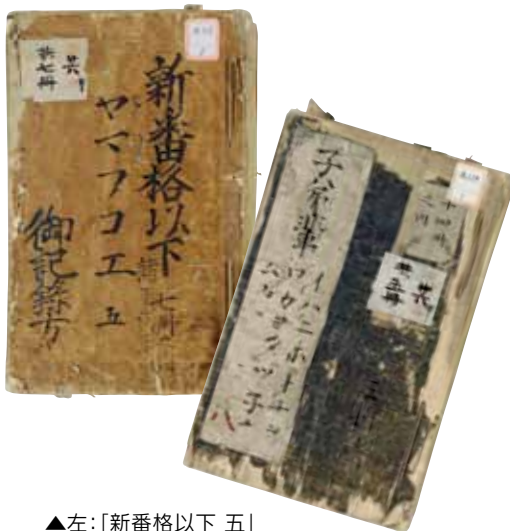
▲左:「新番格以下 五」 右:「子弟輩 八」 松平文庫 福井県立図書館保管