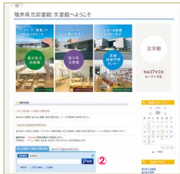
▲総合トップページ