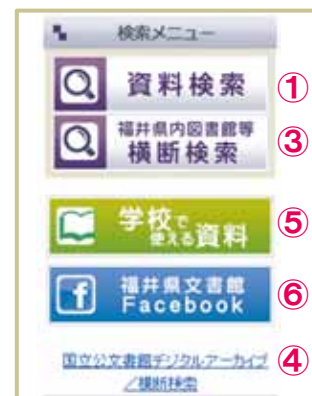
▲文書館トップページより